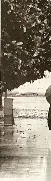
توسعه پایدار نیازمند پیاده‌روها و فضای مناسب برای پیاده‌روی است.

نظیر سرباه مناسب و مقبول به صرفه ، بهداشت و درسا و ارائه خدمات اصلی دیگر به شهروندان، تولید یک محیط امن، ایمنی و فعال که برای بازیگاران باشد و پدید آورد. اتمام ملاحظات اجتماعی و زیست محیطی، خصوصیت بارز و برجسته یک شهر پایدار است.