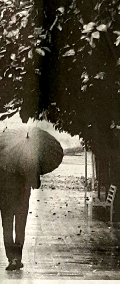
توسعه پایدار نیازمند پیاده‌روها و فضای مناسب برای پیاده‌روی است.

نظیر سرباه مناسب و مقبول به صرفه ، بهداشت و درسا و ارائه خدمات اصلی دیگر به شهروندان، تولید یک محیط امن، ایمنی و فعال که برای بازیگاران باشد و پدید آورد. اتمام ملاحظات اجتماعی و زیست محیطی، خصوصیت بارز و برجسته یک شهر پایدار است.