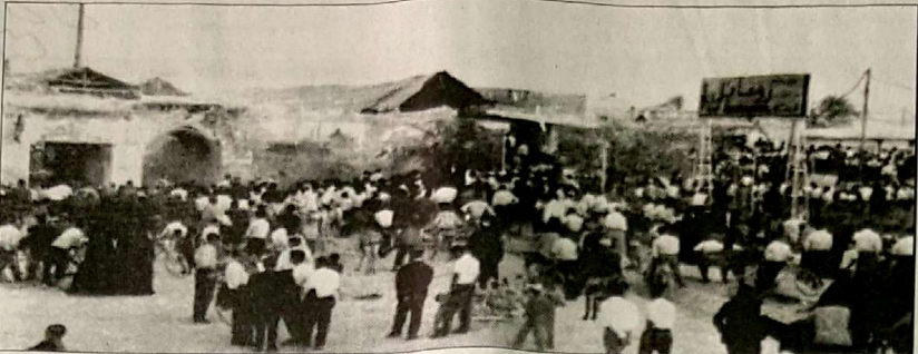
میدان خیرات کازرون در گذشته