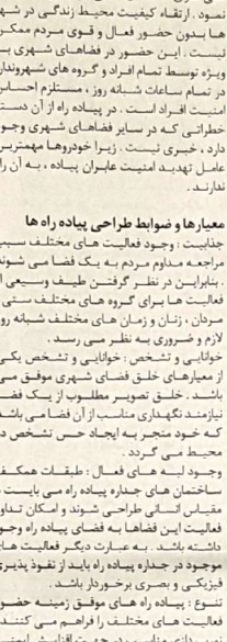
توسعه پایدار نیازمند پیاده‌روها و فضای مناسب برای پیاده‌روی است.

نظیر سرباه مناسب و مقبول به صرفه ، بهداشت و درسا و ارائه خدمات اصلی دیگر به شهروندان، تولید یک محیط امن، ایمنی و فعال که برای بازیگاران باشد و پدید آورد. اتمام ملاحظات اجتماعی و زیست محیطی، خصوصیت بارز و برجسته یک شهر پایدار است.