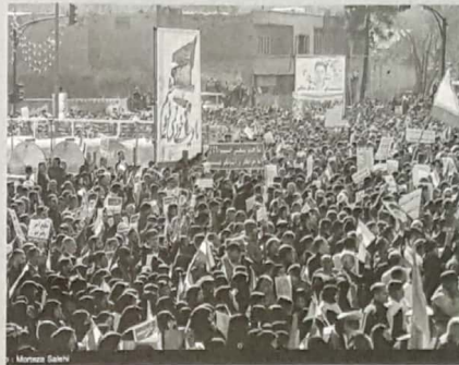
سیاستی E- عبداللهی

چندین شهر و روستای ایران و افغانستان به وجود آمده، توسط تعداد معدودی فریب خورده و تعدادی هم از عوامل اجانب و بیگانگان، هدف تهاجمات و نا ارامی های ۷۸ ساله تا خرداد سال ۸۸ و تا امروز را به هم متصل می کند. عوامل داخلی که در ۱۸ تیر سال ۷۸ مدیریت آن حادثه ای شوم را به عهده داشتند بعد از آن هم در قفسه سال ۸۸ همه کاره شدند با همان پیش و همان اهداف امروز هم خواست آزادی افغانستان گران بوده و آنان را افرادی بی گناه می دانند و در آینده نیز از جانب همین گروه، هدف تهاجمات دیگری بر ما خواهد شد این جماعت که در ۷۸ سال با شعار آزادی سیاسی و جامعه ای مدنی پرزده انتخابات ریاست جمهوری شدند در دوران حکومت خود خردای می دانستند. در آن زمان ایرانیان مخالف جمهوری اسلامی در آمریکا و کشورهای اروپایی همانند زمانی که منافقین وعده می پیوروی در عملیات فریب جویان بودند خارج نشینان داده بودند، چندان هم خود را بسنه و آماده پیروزی به ایران بودند قفسه ۷۸ در ۲۲ تیر ماه برچیده سال و با حضور مردم حزب الله برچیده شد و عملیات فریب جویان منافقین هم به عملیات فریب جویان منافقین شهید سرفراز، شهید سید محمد شیری با کشتن ایرانیان روبه رو گردید و در نهایت تاریخ خارج از کشور هم نامید به خانه هایش برگشتند و توانستند به ایران بیاورند در سال ۸۸ و آن قفسه یزرگ که در انتخابات ریاست جمهوری اتفاق افتاد نیز هم همان افراد و همان گردانندگان قفسه ۷۸ همان دار معرکه بودند البته در رابطه با قفسه سال ۸۸ دستگیر شدند و اکثر آنها در خانت خود اقرار کردند و هر کدام برای چند ماه و یا چند سال به زندان افتادند و بعد هم آزاد شدند. در انتخابات ریاست جمهوری سال ۱۳۹۲ با حمایت از ایشان حسن روحانی در نتیجه پیروزی ایشان ۵۰/۷ درصد آراء