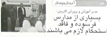
مدرسه آموزش و پرورش کارزون