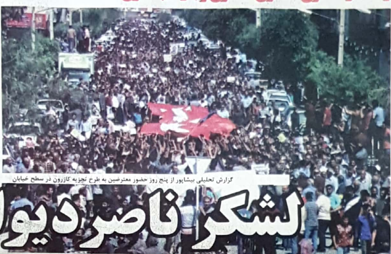
گزارش تحلیلی بشاپور از پنج روز حضور معترضین به طرح تجزیه کازرون در سطح خیابان