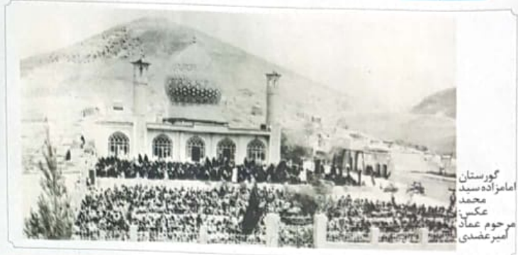
گورستان امامزاده سید محمد امیرعسقلی

طرح عدم انتشار این خبر، صبح روز یکشنبه ۶ خردادماه، پایگاه اینترنتی خیرگرایی صداوسیما در استان فارس، خبری مکرر را به نقل از وزیر منتشر نموده که خبر مربوط به خیرگرایی برنا را تکذیب می‌کرد. خیرگرایی صدا و سیمای مکرر فارس در این خبر آورده بود: «جسار زاده با تکذیب این خبر که برخی خیرگرایی‌ها به نقل از دولت منتشر کرده بودند، گفت: موضوع تقسیمات کشوری در دستور کار وزارت کشور قرار دارد و مطرح تقسیم برخی مناطق، برای کارشناسی بیشتر موضوع و در نظر گرفتن همه جنبه‌ها در دست بررسی است. معاون وزیر کشور از همه مردم، به ویژه مناطقی که در طرح تقسیمات کشوری قرار دارد خواست: مواظب خبرهای غیر موثق که برخی منابع خبری منتشر می‌کنند نباشند و برای صحت و سلامتی خود و خانواده‌ها، رسانه‌های رسمی کشور رجوع کنند. یکی از سبب‌های خبری به نقل از دولت خبری مبنی بر لغو شدن طرح تقسیمات کشوری در استان‌ها منتشر کرده بود. استاندار فارس هم با اشاره به تماس خود با وزیر کشور و سایر مقامات وزارت کشور افزود: هیچ